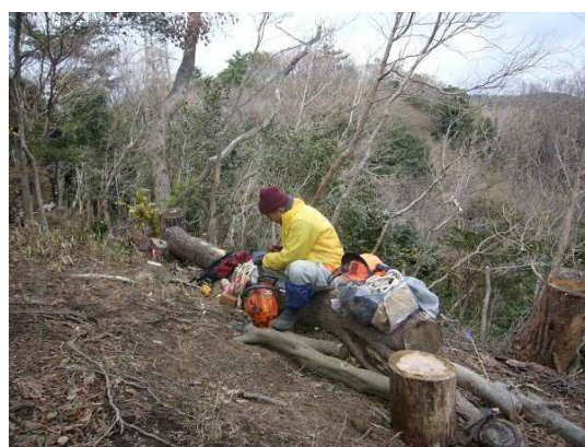
昼食休憩後、チェーンソー目立て