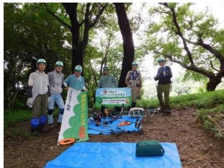
作業説明 (安全管理徹底)