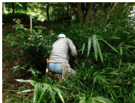
ネザサの刈込み作業