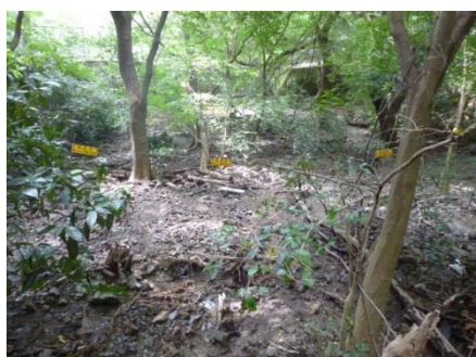
第二堰堤 土石流センサーに余裕あり