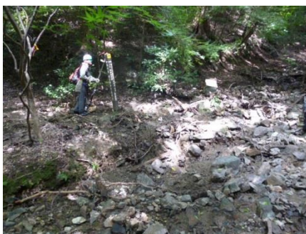
川筋が変わっていた分岐点