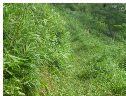
どんどん刈り込んでいきます