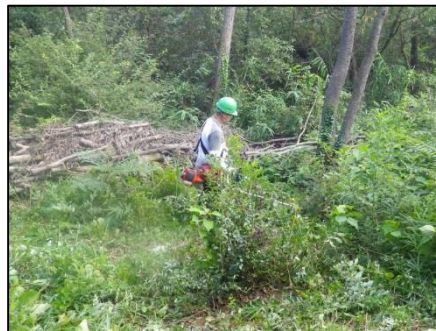
少しずつ刈り取っていきますが…