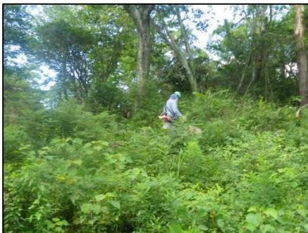
二箇所目も一面のカラスザンショウ