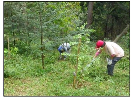
一箇所目は1時間ほどで完了