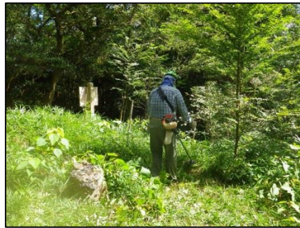
刈払機での下草刈り