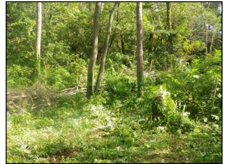
残りは次回の活動で