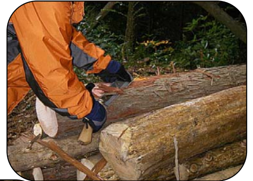
丸太の樹皮をはぎます

間伐した木材は丸太にした後、樹皮をはいで山積みになります。乾燥させた後、登山道の補修に使うためです。