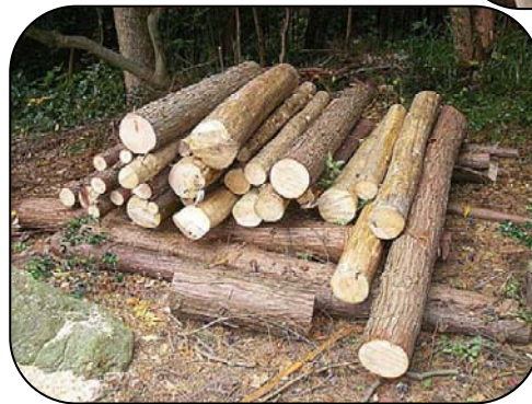
丸太を積んで乾燥させ、登山道の補修に使います