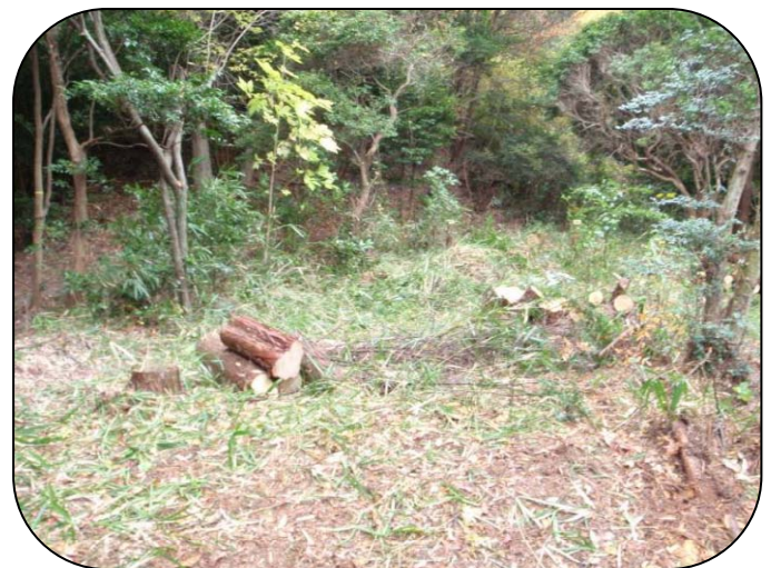
下草刈りを終えた場所はきれいになりました