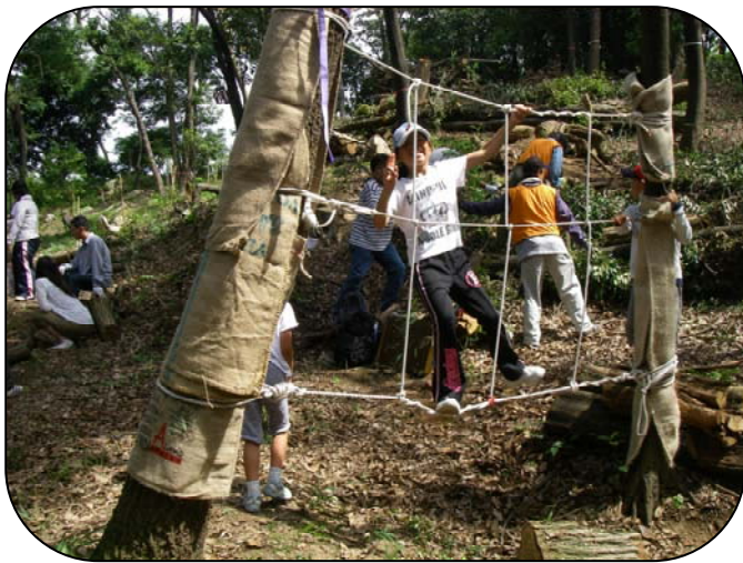
空中回廊に笑顔・笑顔

続いて、お待ちかねの山遊び体験と生き物観察です。山遊び体験では、立ち木や丸太を利用した遊具で子供たちが楽しく遊びました。生き物観察では、カブトムシやミミズを見つけて大喜びでした。