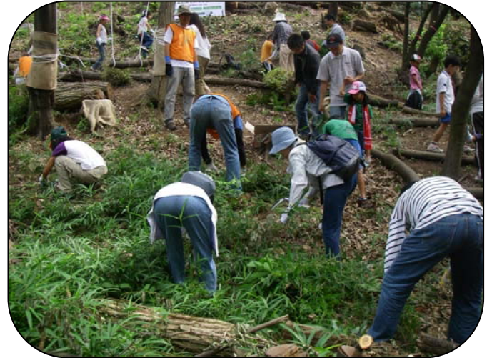
参加者全員で下草刈り

まず、体験学習として、活動地の下草刈りを行いました。いつもは1時間以上かかる作業ですが、みんなで力を合わせたら10分程で終わりました。