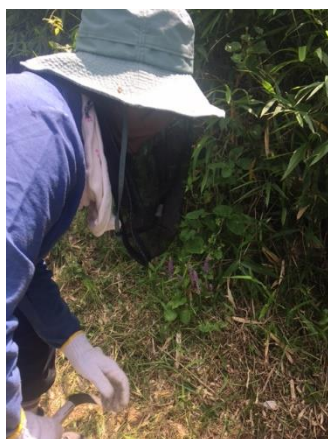
細かなところは手刈り