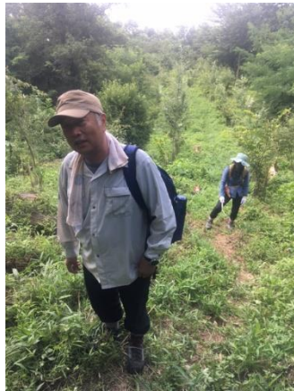
やよいみち階段下に到着

総勢5人で金鳥山南尾根筋の管理道「やよいみち」で、植樹したヤマザクラの育樹活動と刈払機を使っでの整備活動を行いました。熱中症にならない様にこまめに休憩しながら、無理なき程度に午前中で活動を終えた次第です。