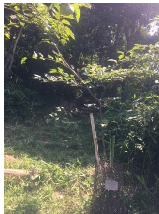
一番大きく育ったヤマザクラ