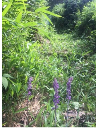
陽当たりの良い場所 ヤブラン