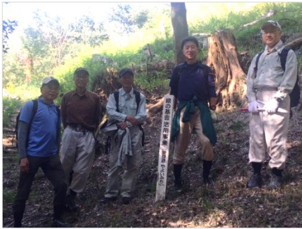
新人も入り集合写真

植樹会中のコベルコシステムの皆さんにご挨拶しながら、金鳥山階段経由で下山しました。途中、保久良神社境内のほくらぐるーぷ倉庫で保管していた六甲ヤマボウシ活動地から搬出した樹木保護ネット&支柱の員数確認と整理を行いました。