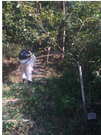
成長しているヤマザクラ