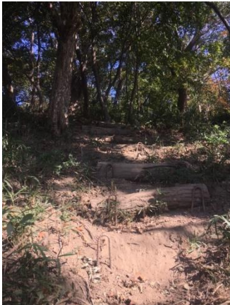
横木が飛ばされたやよいみち