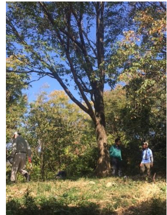
金鳥山前山で休憩