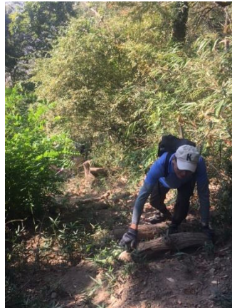
飛ばされた重い横木の再構築