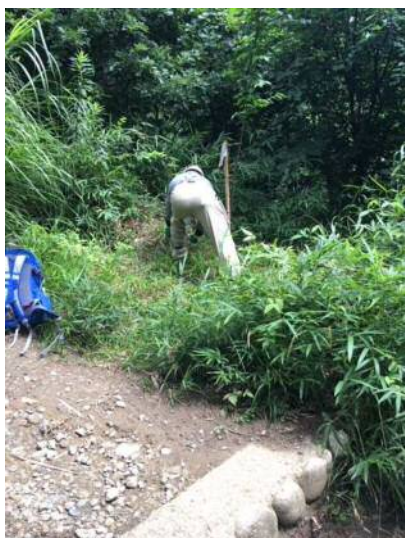
金鳥山階段横の坪刈り