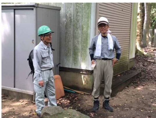
蒸し暑いですが、長袖とヘルメット着用