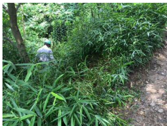
登山道奥の植樹木周辺の下草刈り