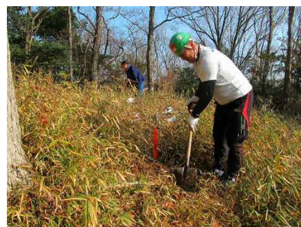
東京海上日動火災保険活動地内