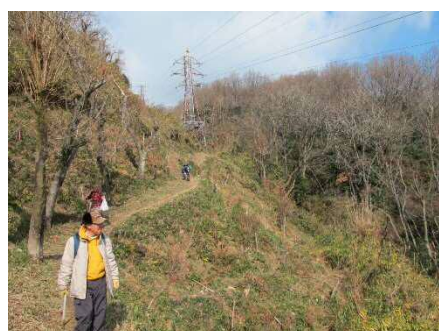
葉大尾根の南斜面はポカポカ陽気