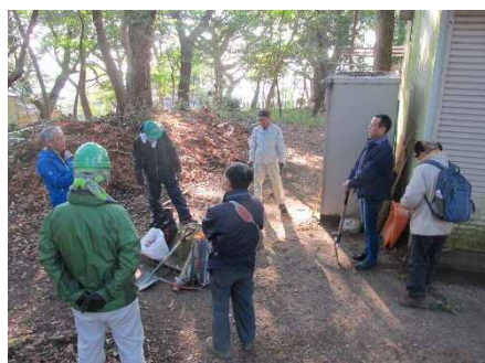
寒い朝の活動開始前ミーティング

大寒波による降雪後の活動地に有志 9 名が集まり、一週間後に開催予定の「第 2 回ヤマザクラ一斉植樹会」に向けての準備作業として、植栽予定ポイントの事前穴掘りやナンバリング処理などを行いました。心配した寒さも、神戸薬科大学の尾根の日当たりの良い南斜面では、上着を脱ぐほどの暖かさになりました。あとは、当日のお天気に期待しています。