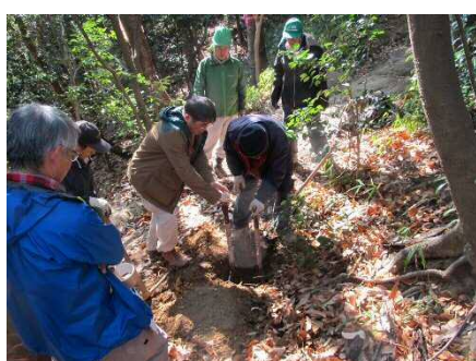
最後は全員で大穴掘り