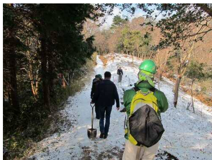
活動地に向う途中は雪景色