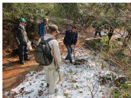
最初の植栽ポイントでの穴掘り開始