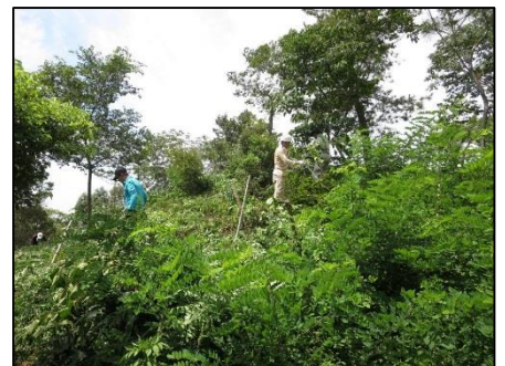
応援の仲間もニセアカシアと格闘中