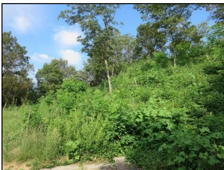
下草に覆い尽くされた活動地

蒸し暑い中での作業でしたが、播磨支部より6名が初めて応援に駆けつけてくれたおかげで、作業がはかどりました。来月以降でもっと美しく整備したいと思います。