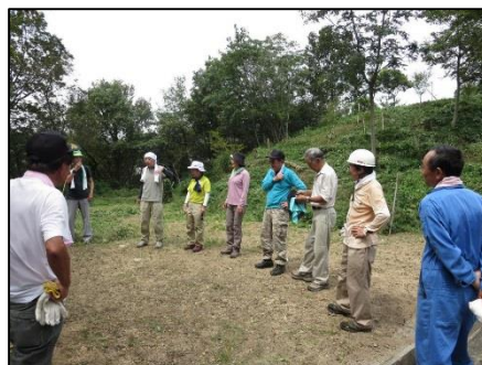
播磨支部の皆さんを交えての報告会