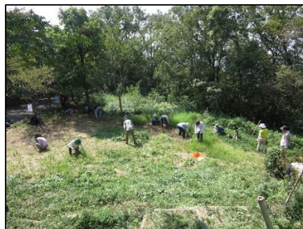
久々に草刈りに励んでいます