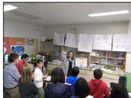
どんぐりの植え方の説明