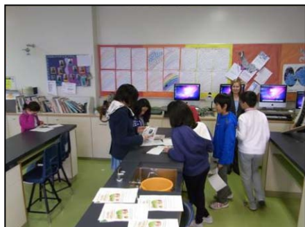
テキストを予習中

2 年後、私達の活動地「きぼうの森」に植えに行くのを楽しみに、しっかりと 育てていきます。