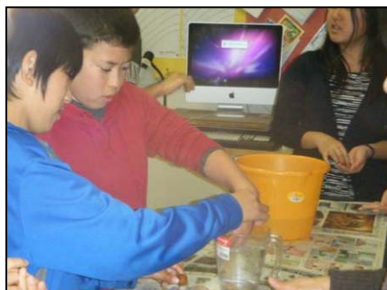
どんぐりは浮かか？沈むか？