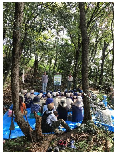
パネルを使っでの説明