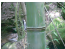
マダケ 節の突起が2本