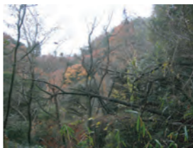
倒木したニセアカシア