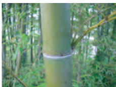
モウソウチク 節の突起が1本