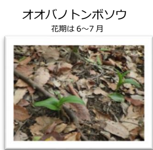
オオバノトンボソウ 花期は6~7月