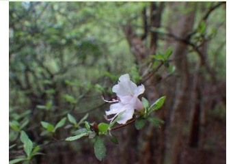
シロバナウンゼンツツジ