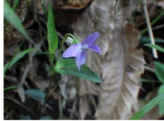
ナガバタチツボスミレ