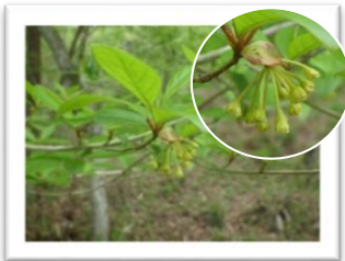
カナクギノキ 花期は4~5月