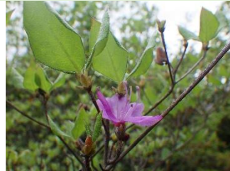
コバノミツバツツジ