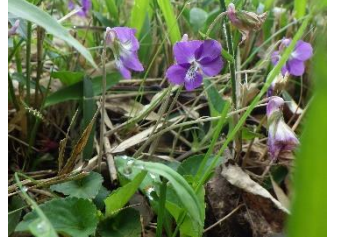
ニオイタチツボスミレ

活動地に多い モチツツジ・コバノミツバツツジ 少ない ヤマツツジ・シロバナウンゼンツツジ