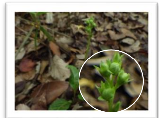
イチヤクソウ 花期は6~7月