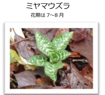
ミヤマウズラ 花期は7~8月