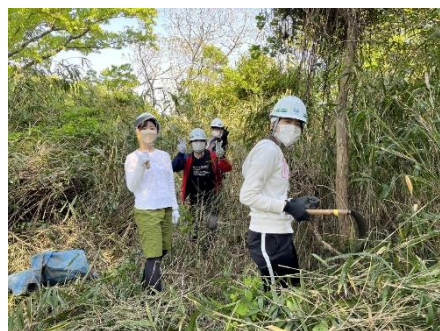
楽しく活動しています！