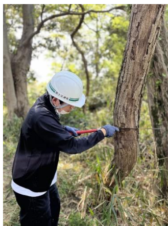
真剣に取り組んでいます