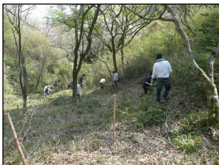
すっきりとしてきました