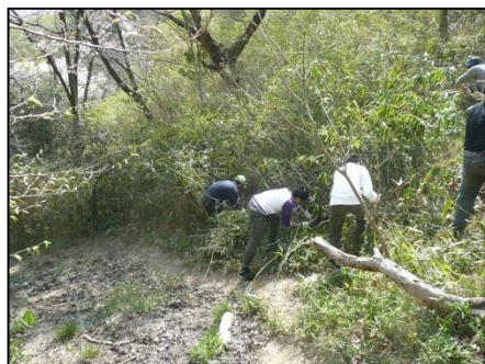
伸び放題のネザサの刈り取り

これまでに植樹をした場所のネザサはあまり伸びていなかったため、南斜面のネザサ刈りを行いました。登山途中で、整然ときれいに植樹場所を手入れされているところがあり、大変参考になりました。次回植樹する時は、活動地全体のバランスをみて計画したいと思います。