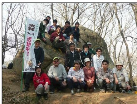
蛙岩の前で集合写真