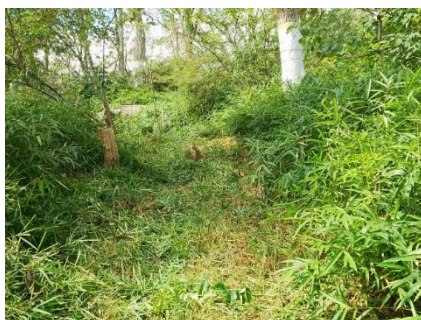
通行可能になった作業用通路