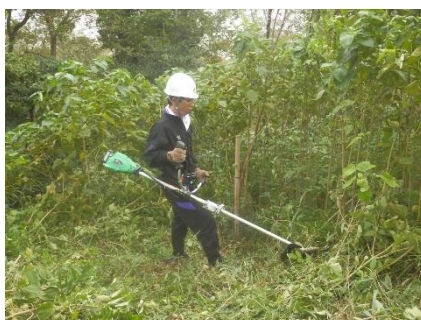
刈払機による除草作業