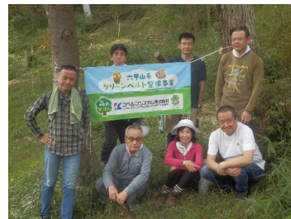
作業終了後に記念撮影