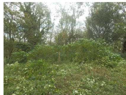
作業終了後の尾根の丘