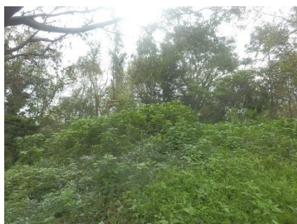
雑草に覆われた尾根の丘

休憩所西側の谷筋のニセアカシア萌芽再生枝、ネザサやつる性植物などに手を取られてしばらく手つかずだった尾根の丘や、休憩所と西側林道とを結ぶ作業用通路は、夏の間ネザサや雑草に覆いつくされていましたが、これらの場所も作業の終了時にはある程度きれいになりました。