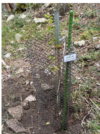
プレートをつけて植樹完成