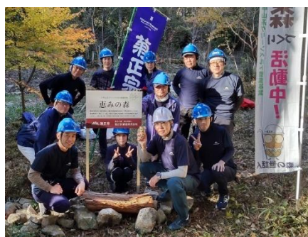
作業後の集合写真