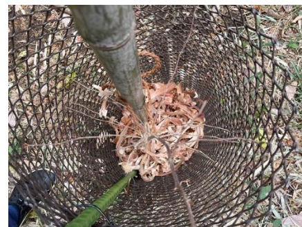
雑草除けの樽チップ