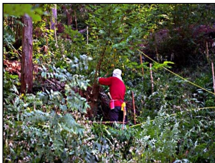
ニセアカシアの萌芽は トゲがあるので注意