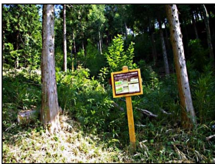
作業前の ANIMA の森 ササや雑草に覆われています

今回残念だったのは、この春植えた苗のうち、半分ほどは枯れてしまったり、ウサギなどが食べてしまったりして、なくなってしまった事です。自然環境は厳しいので、そういったこともあります。森づくり活動は、何年もかかる壮大な計画です。鉢植えと違い、最初に植えた苗がそのまま大きく育って森になるわけではありません。今後も計画的に活動していきます。