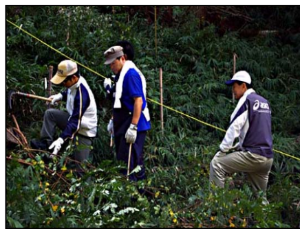
膝から腰ほどもあるササや雑草