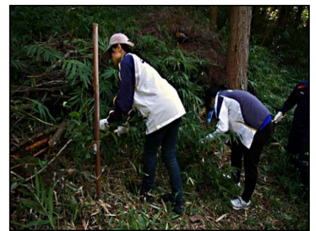
竹の棒は、苗を植えた目印 苗を刈らないよう慎重に作業