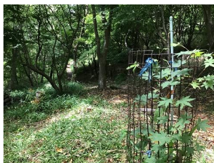
順調に育つコハウチワカエデ