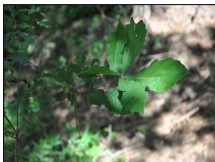
4月に植樹したコナラの幼木