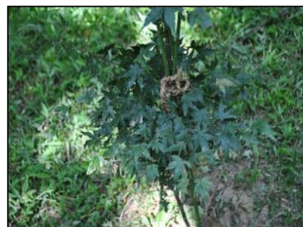
4月に植樹したイロハモミジの幼木