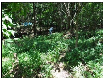
ネザサやコチヂミザサが繁茂