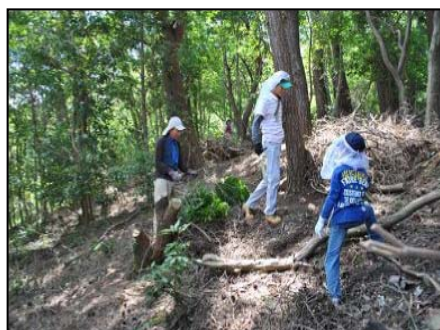
暗かった尾根筋にも光が差し込むように