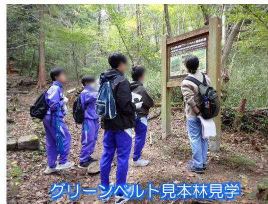
グリーンベルト見本林見学