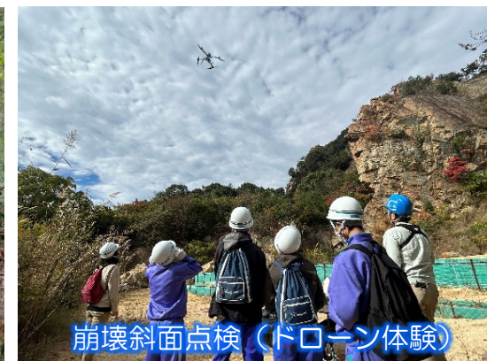
崩壊斜面点検（ドローン体験）