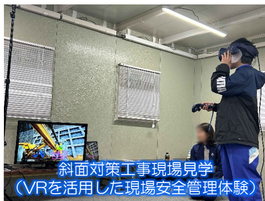
斜面对策工事現場見学 （VRを活用した現場安全管理体験）