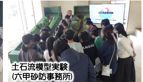
土石流模型実験 (六甲砂防事務所)