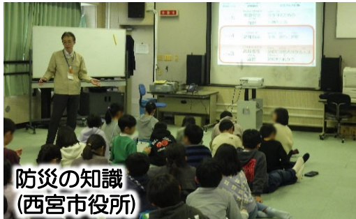
防災の知識 (西宮市役所)