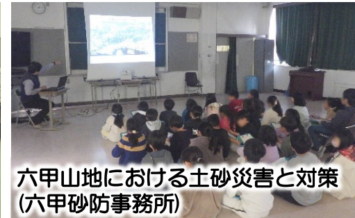
六甲山地における土砂災害と対策 (六甲砂防事務所)