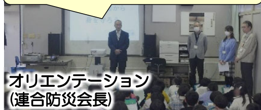
オリエンテーション (連合防災会長)