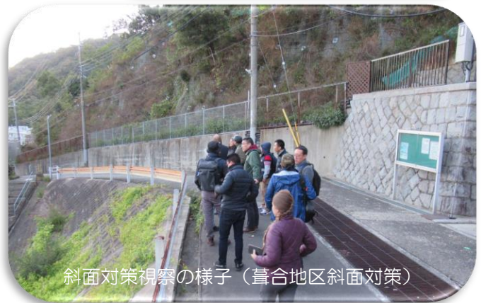
斜面对策視察の様子（葦合地区斜面对策）