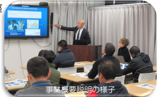
事業概要説明の様子

事業概要説明では、六甲山地で実施している砂防堰堤の整備等の土砂対策事業や、六甲山系グリーンベルト整備事業での取り組み、各事業での課題について説明しました。現地視察では、都市部に隣接している砂防堰堤や斜面对策を見てもらうことで砂防事業の重要性・必要性を実感いただき、エクアドルで必要とされる土砂災害に対する政策や対策技術について学びを得ていただくことが出来ました。