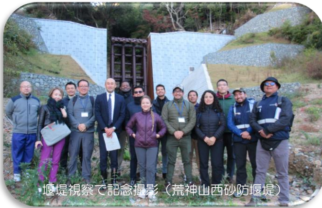
堰堤視察で記念撮影（荒神山西砂防堰堤）