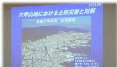
六甲山地における土砂災害と対策について