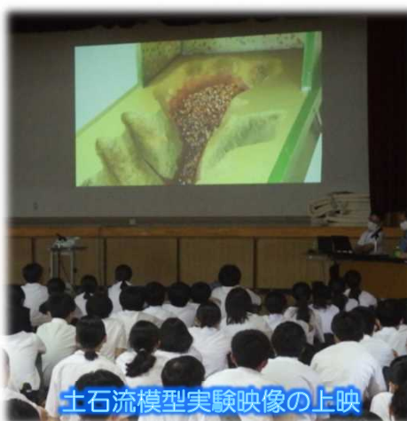
土石流模型実験映像の上映

8月から防災学習を行っており、生徒も興味を持って取り組んでくれています。 (烏帽子中学校校長先生)