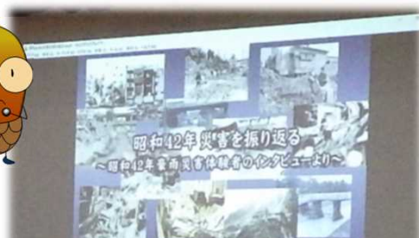
昭和42年災害を振り返る映像の上映