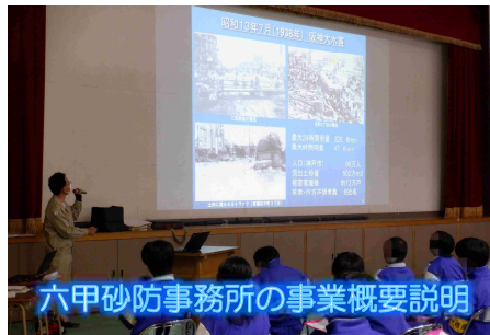
六甲砂防事務所の事業概要説明