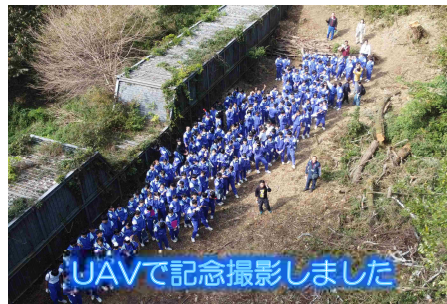
UAVで記念撮影しました