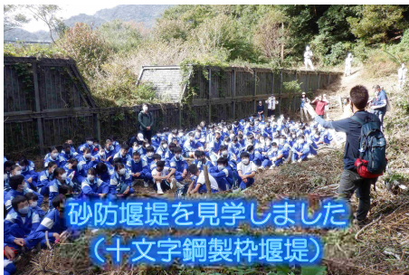
砂防堰堤を見学しました (十文字鋼製枠堰堤)