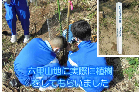
六甲山地に実際に植樹 をしてもらいました

生徒の皆さんから『実物を見るだけではわからない砂防堰堤について説明をしてもらったおかげで、砂防堰堤が作られた理由や自分たちの住んでいる町が堰堤によって守られていることがよく分かり、堰堤見学が有意義なものになりました』『植樹活動は楽しく、木を植えて地球を守れるので良いと思いました』『グリーンベルト事業には多くのボランティアの方々が参加し、今の六甲山を保つ努力をされていることを聞いて、自分たちも活動してみたいと思いました』との感想をいただきました。