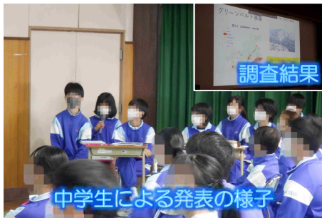
中学生による発表の様子