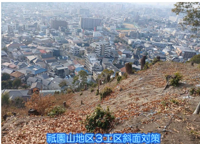
祇園山地区3工区斜面对策