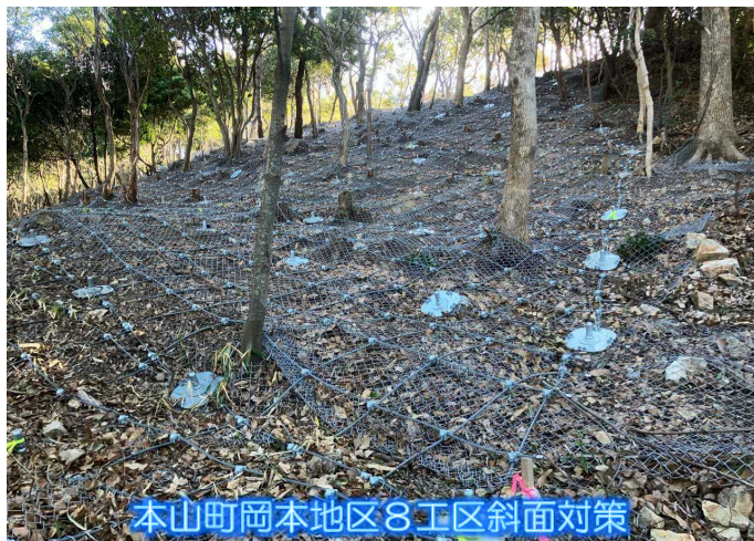
本山町岡本地区8工区斜面对策