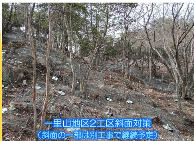
一里山地区2工区斜面对策 (斜面の一部は別工事で継続予定)