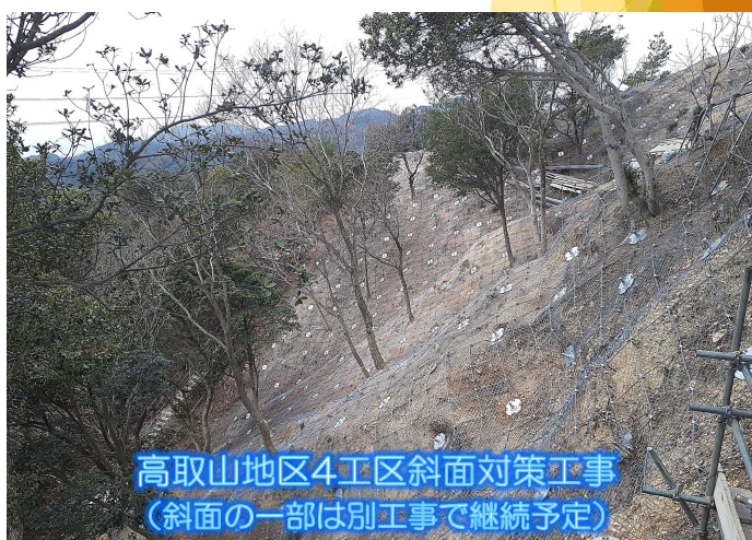
高取山地区4工区斜面对策工事 (斜面の一部は別工事で継続予定)