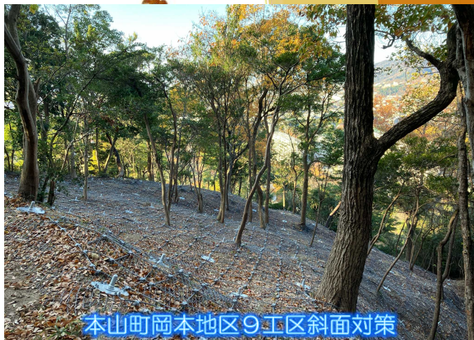
本山町岡本地区9工区斜面对策