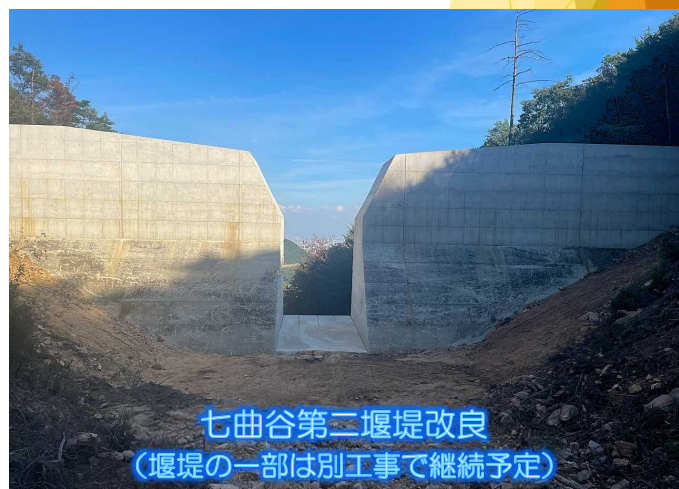
七曲谷第二堰堤改良