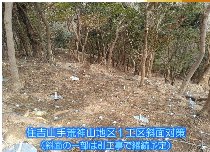
住吉山手荒神山地区1工区斜面对策 (斜面の一部は別工事で継続予定)