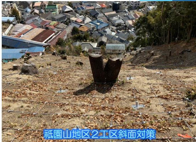
祇園山地区2工区斜面对策