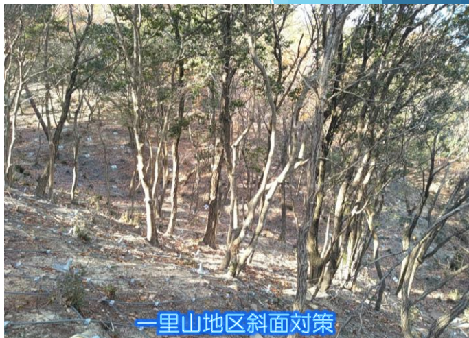
一里山地区斜面对策