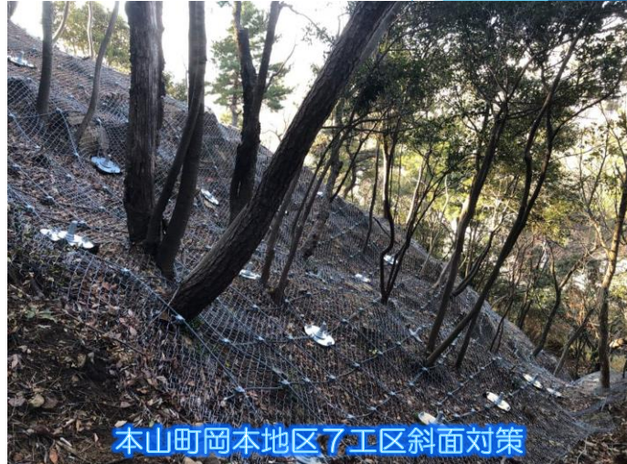
本山町岡本地区7工区斜面对策

※その他の工事情報は、 https://www.kkr.mlit.go.jp/rokko/koji/index.php をご覧ください。