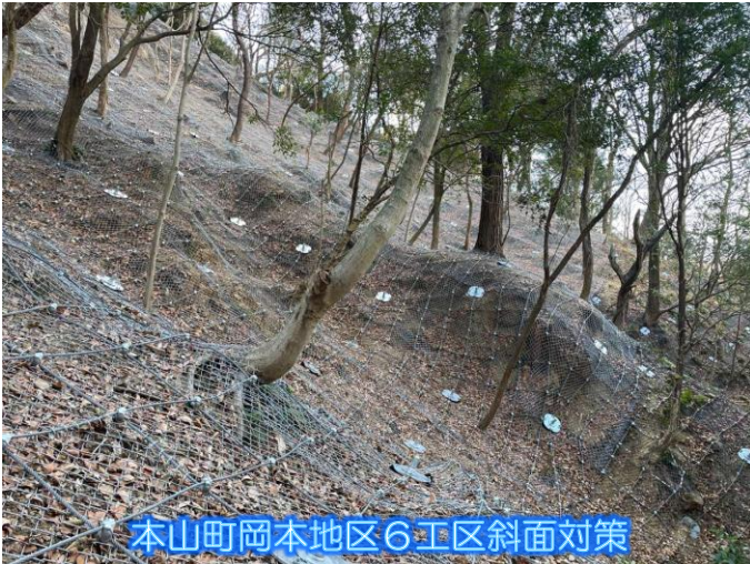
本山町岡本地区6工区斜面对策