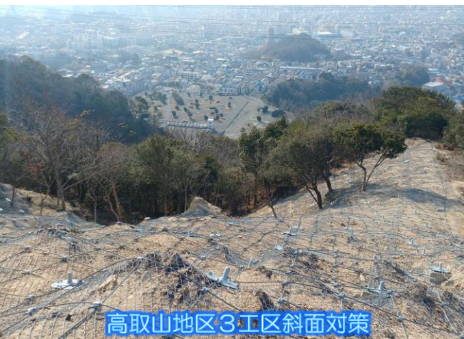
高取山地区3工区斜面对策