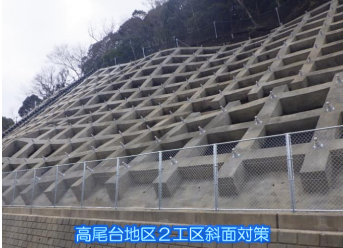
高尾台地区2工区斜面对策