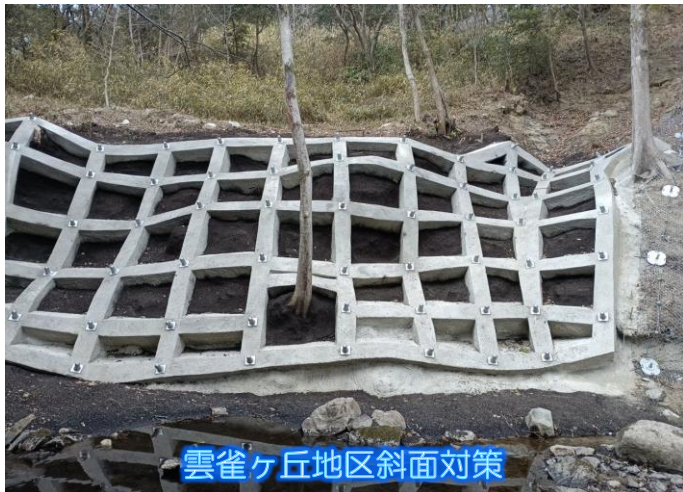
雲雀ヶ丘地区斜面对策