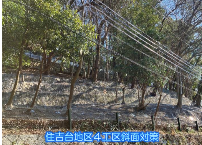
住吉台地区4工区斜面对策