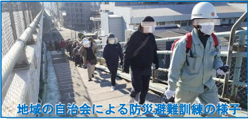
地域の自治会による防災避難訓練の様子