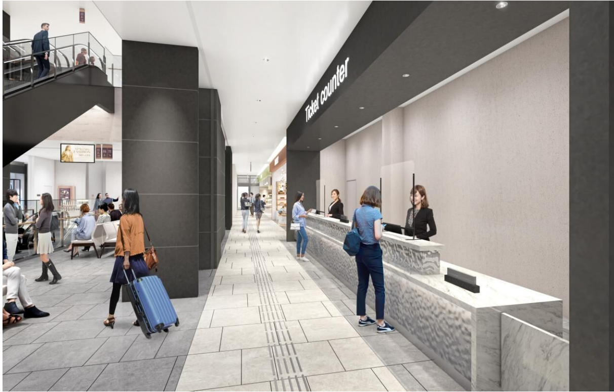
2F チケットカウンター(イメージ)