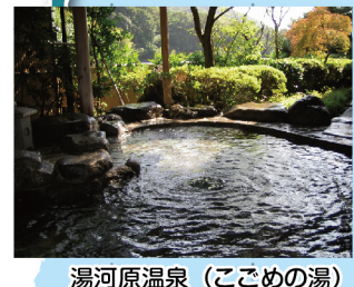
湯河原温泉 (こごめの湯)