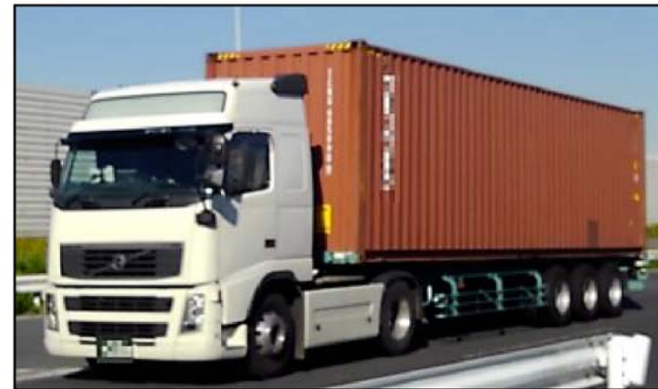
国際海上コンテナ車(40ft背高)