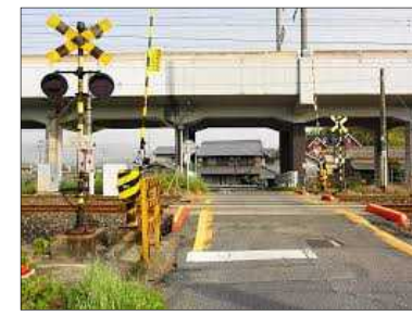
遮断機・警報機の整備