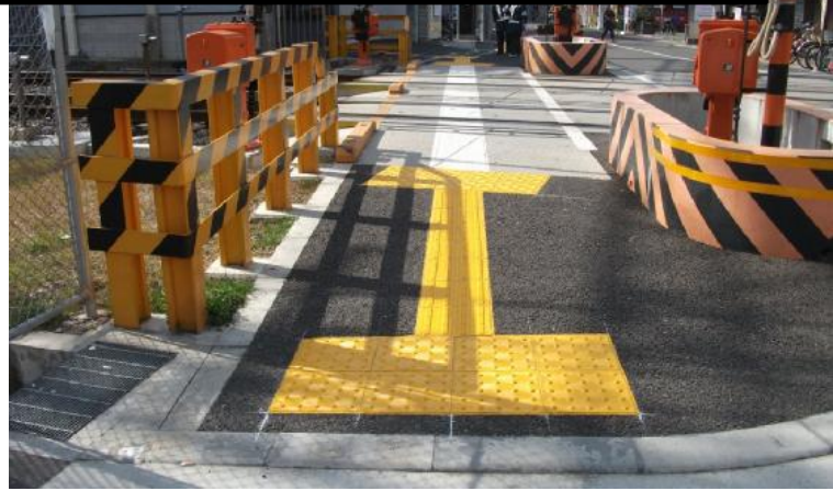
■ 二色浜4号踏切(大阪府泉佐野市鶴原)