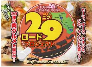
1129(イイニク)感謝祭チラン(沿線全線)