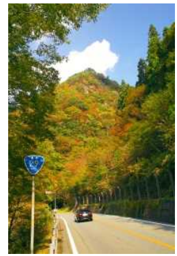
秋晴れのドライブ(宍粟市)