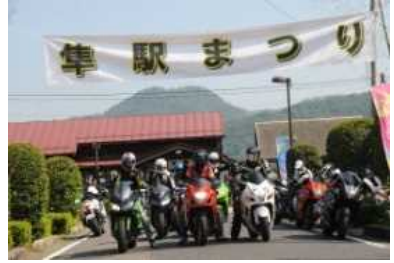
隼駅まつり(八頭町)