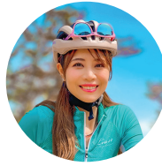
自転車系YouTuber あむちゃん!

チラシ裏面の 参加申込書 に必要事項をご記入の上 八頭町観光協会窓口までご持参 FAXにてお申込み fax 0858-73-0970