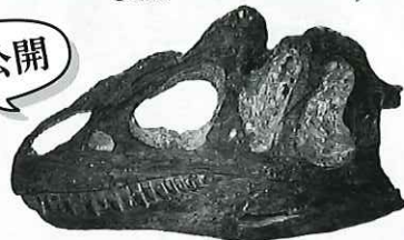
▲アロサウルス・ジムマドセニ(実物 タイプ標本)