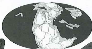
◀三畳紀の地球 Cao et al. (2017)より改変