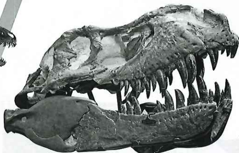
▲ティラノサウルス「ブラックビューティー」頭骨(実物)

花を咲かせる植物が生い茂り、草食恐竜が多様化した後期白亜紀アルバータ州の恐竜を中心に当時の様子を紹介