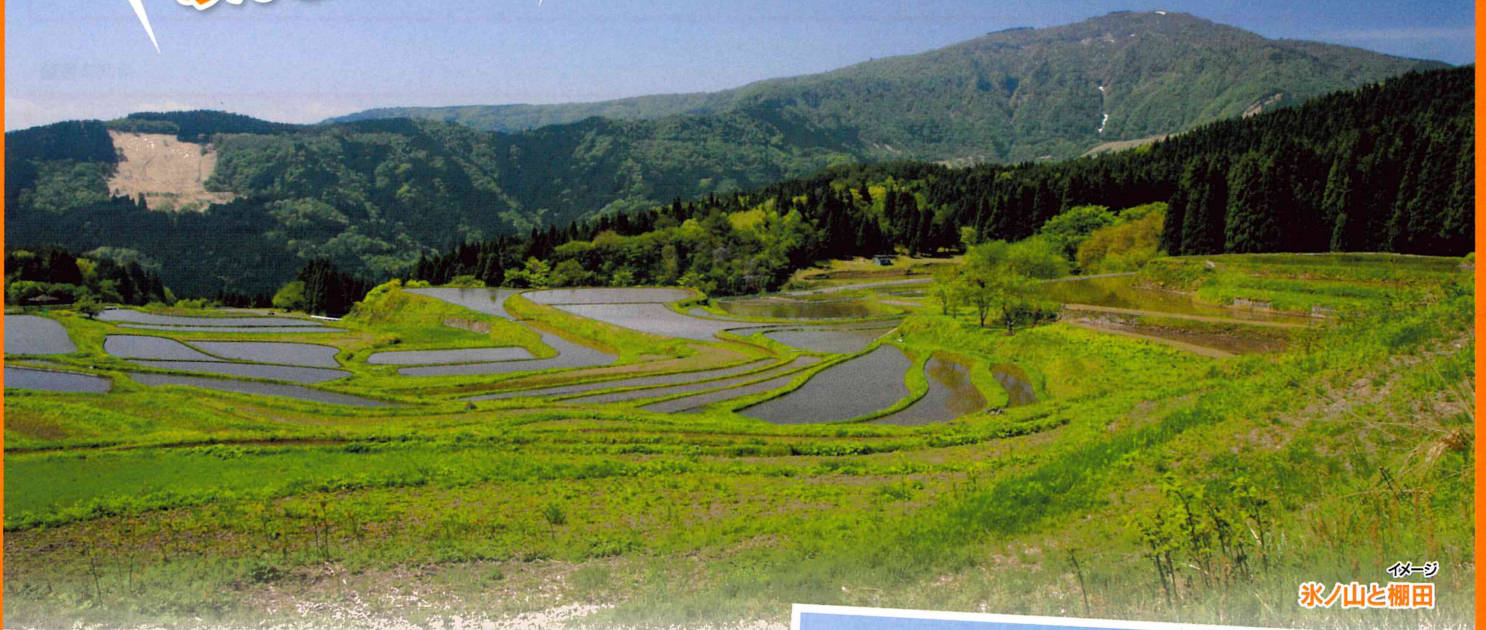
イメージ 氷ノ山と棚田