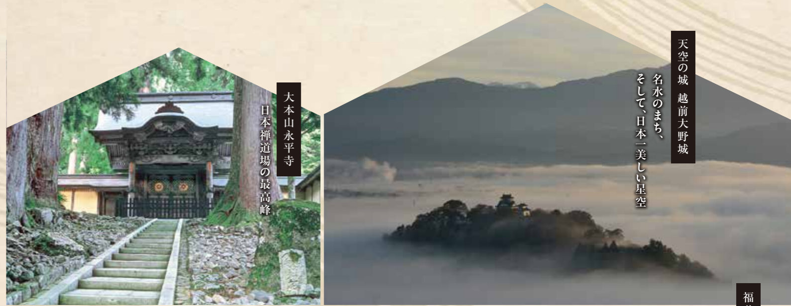
天空の城 越前大野城 名水のまち、 そして、日本一美しい星空

白山の麓、福井県のやまぎわをつなぐエリアには、栄華を極めた要塞都市、 全国一とうたわれる匠の技巧、現在も俗化されていない「日本の宝」など8つの日本一が存在します。 そんな8つの日本一をつなぐ「やまぎわ天下一街道」を巡る旅です。