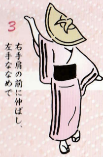
3 右手肩の前に伸ばし、 左手ななめで