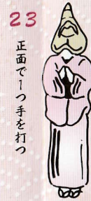
23 正面で1つ手を打つ