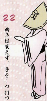
22 向きは変えず、手を1つ打つ