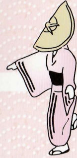
21 右前に左足を踏み込みながら 両手開き 右、左と出て揃える。