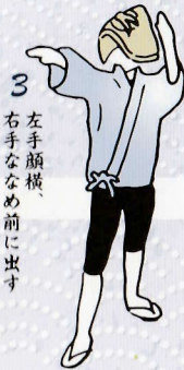
3 左手顔横、 右手ななめ前に出す