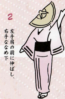
2 左手肩の前に伸ばし、 右手ななめで