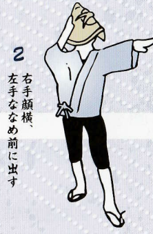
2 右手顔横、 左手ななめ前に出す