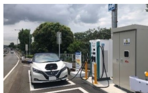
▲路上EV充電機器 (横浜市)