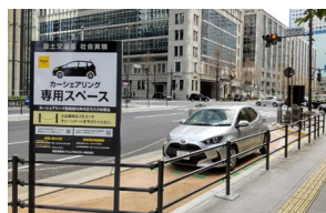
▲路上カーシェアステーション (東京都港区新橋)