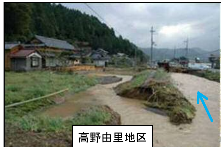
高野由里地区 平成16年台風23号による被害 『浸水家屋 798戸、浸水面積 52ha』