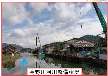
高野川河川整備状況