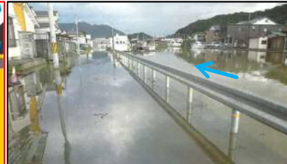
令和元年台風18号による高潮被害