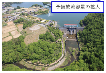
青野ダム(多目的) 事前放流40万m 3 (H21.2 20万m 3 運用開始・R2.6容量拡大・今後予備放流化)