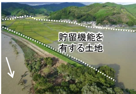
貯留機能を有する土地のイメージ