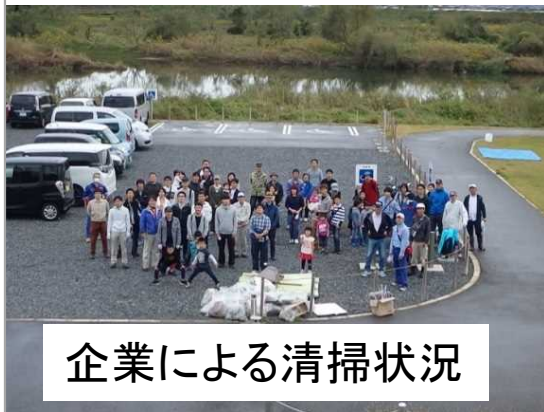
企業による清掃状況