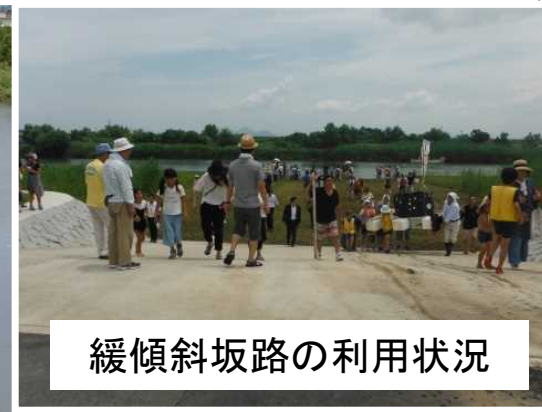
緩傾斜坂路の利用状況