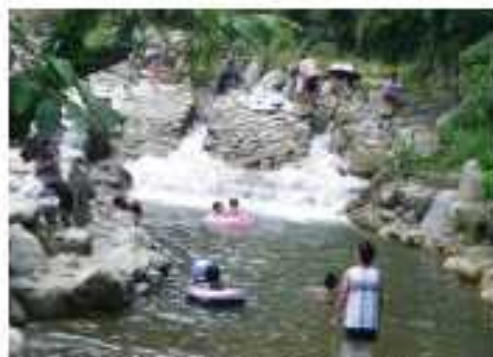
河川管理者と市町村等が連携して親水空間を整備