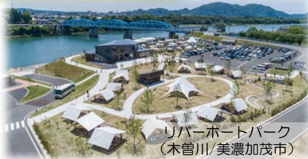
リバーポートパーク (木曽川/美濃加茂市)