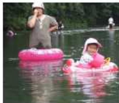
水辺の体験学習等のイベントを開催し、水源地域に賑わいを創出

○「かわまちづくり」の計画作成に、民間事業者が積極的に参画できることとしました。これにより、 民間事業者の発意による河川空間の形成が実現可能 となり、民間事業者と河川管理者が連携した水辺整備を行い、外国人観光客を魅了するような魅力ある河川空間を創出し、地域を活性化します。