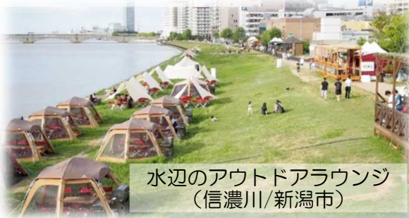
水辺のアウトドアラウンジ (信濃川/新潟市)