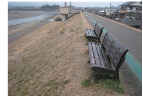
ベンチの設置 注）占用許可を受けて設置しています。