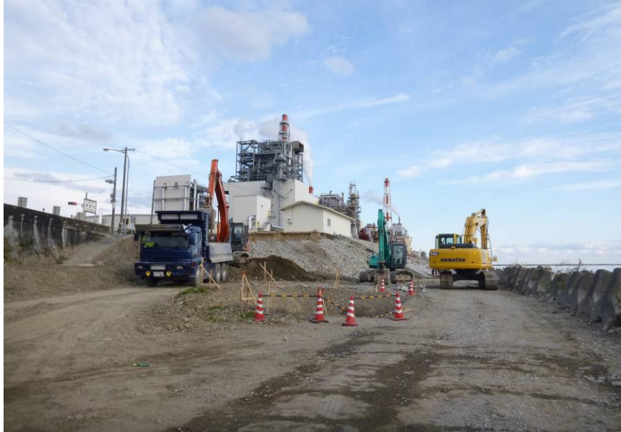
矢渕地区護岸災害復旧工事状況