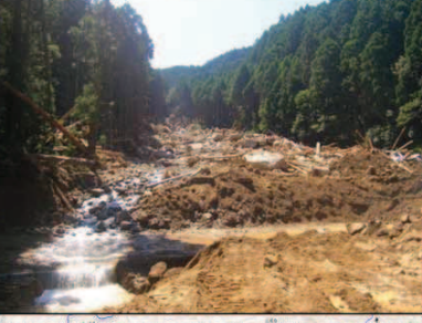
被災状況⑳(新宮市相賀)