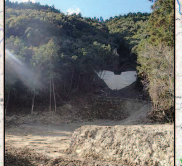
完成状況⑮(新宮市熊野川町九重和田)