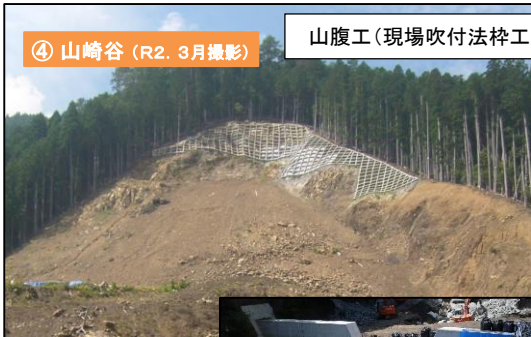
山腹工 (現場吹付法砕工)