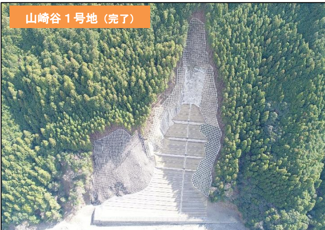
山崎谷 1号地 (完了)