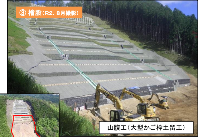
山腹工 (大型かご砕土留工)