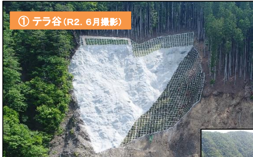
山腹工 (簡易法砕吹付工・モルタル吹付工)